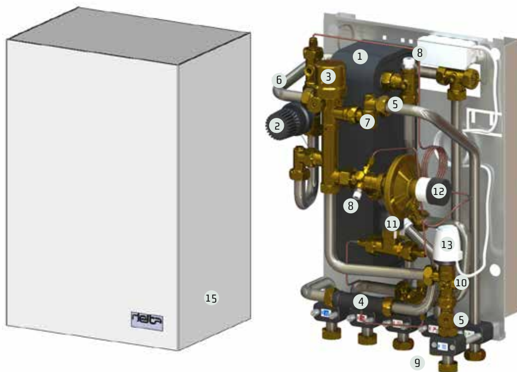
Waal Compact 2.0 (met optionele mantel)